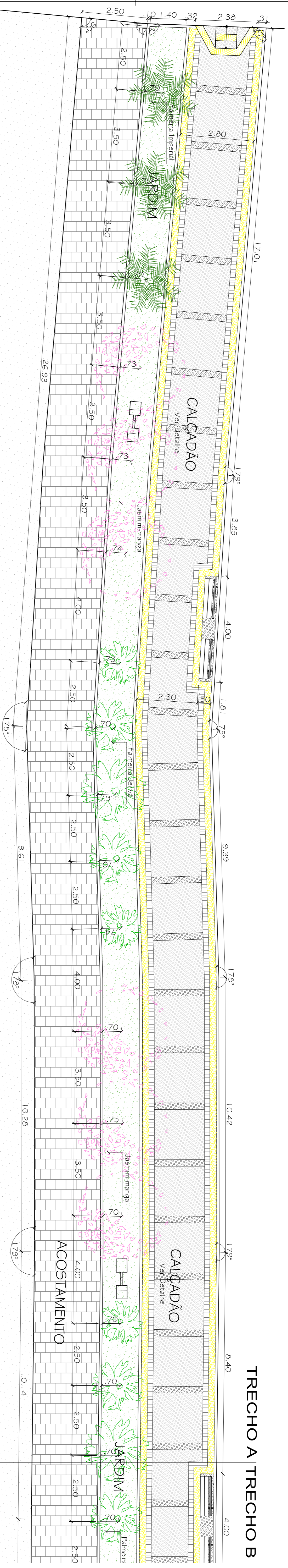
PLANTA BAIXA - TRECHO A URBANIZAÇÃO DO ANEL VIÁRIO DA AVENIDA MANOEL JANÚCIO Escala: 1/75