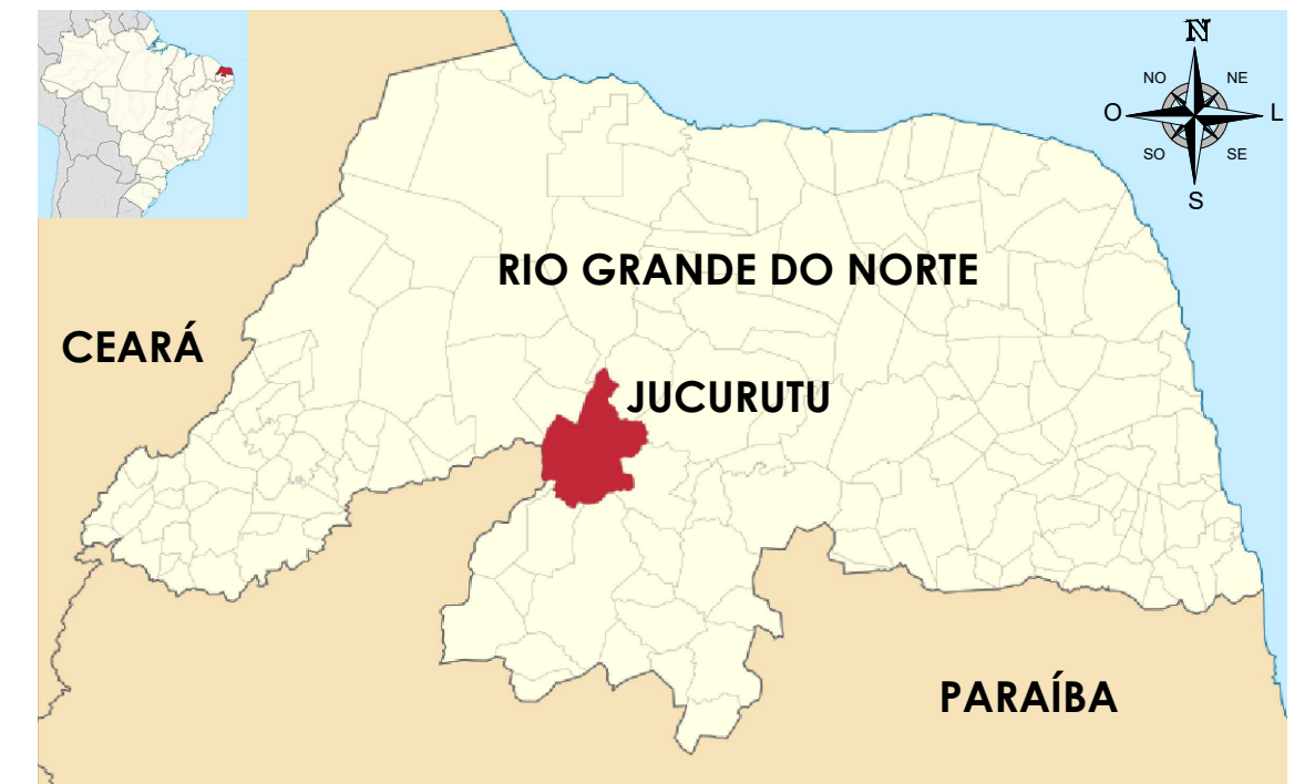
PLANTA DE LOCALIZAÇÃO Pavimentações, Jucurutu/RN Sem escala